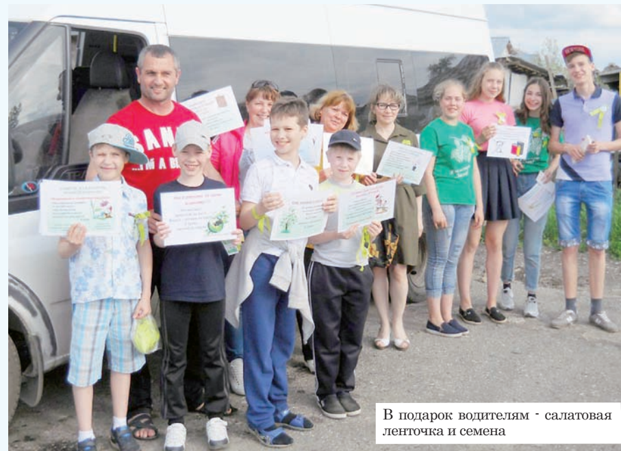
В подарок водителям - салатная ленточка и семена

Проект «ЭкоДАТА» уже известен лисьвенцам. Кстати, его название расшифровывается как «экологическое движение в автобусе и в транспорте». Всего два года назад юные экологи уже проводили подобную акцию – тогда все маршрутки города были украшены призывами не выбрасывать батарейки, ведь каждая стоит жизни двум кротам, одному ёжику и тысяче дождевых червей.