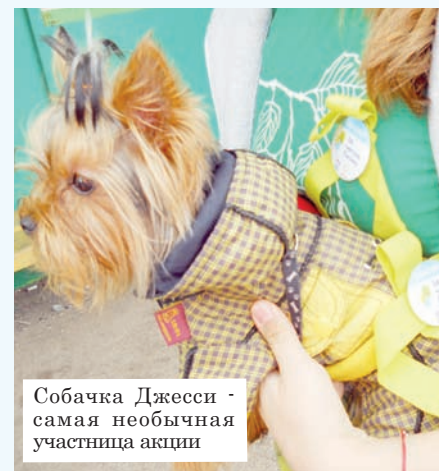
Собачка Джесси - самая необычная участница акции